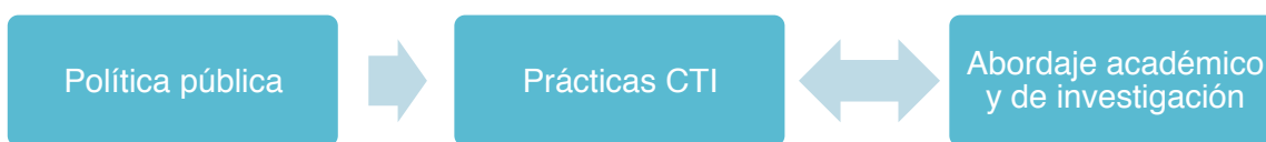
Fig. 3 Flujo de interacción conceptual sobre la Divulgación. Fuente: Elaboración propia. 2017

Por otro lado, encontramos que el flujo de interacción conceptual parte desde la política pública hacia las prácticas CTI y se retroalimenta, modifica y ajusta en relación a los abordajes que desde la academia y la investigación se llevan a cabo continuamente; de tal suerte que el componente institucional responderá a los preceptos de la política pública y los divulgadores encontrarán mayor referencia en los abordajes académicos y de investigación, aunque los esfuerzos de ambos coinciden en las prácticas cotidianas que en materia de CTI y su Divulgación se llevan a cabo en el escenario actual.