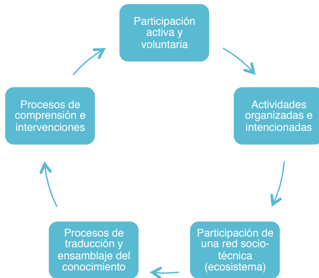
Fig. 4 Elementos integrantes de la actividad divulgativa.

Con ellos, se maximiza la oportunidad de generar un impacto que trascienda la esfera cuantitativa en las actividades de divulgación, es decir, que dichas acciones pasen de ser un escenario de educación no formal donde se muestren hallazgos, descubrimientos, innovaciones y saberes a los públicos, y se conviertan en facilitadores del cambio cognitivo.