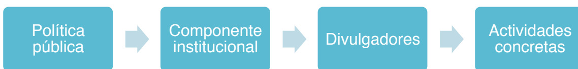
Fig. 1 Ecosistema de Divulgación en Michoacán. 2017.

Partimos de asumir que el estado de Michoacán cuenta con amplias fortalezas y trayectoria en materia de Divulgación de CTI, dado el ecosistema que se encuentra conformado en el presente por la Política Pública, el componente institucional y el componente de los divulgadores, actores que en su conjunto son quienes llevan a cabo las actividades concretas que pueden ser catalogadas dentro de los parámetros de la Divulgación.