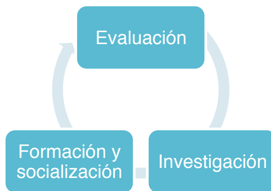
Fig. 6 Ciclo del proceso evaluativo. Fuente: Sigríd Falla Morales. 2015.

situados en contexto y analizados de forma pormenorizada; con la finalidad de que los datos hablen y su respuesta coadyuve a un mejor diseño y operación de las actividades.